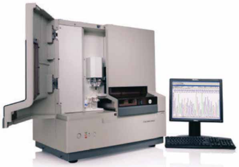
ABI PRISM 3100

Para cumplir con nuestra promesa de entrega de resultados en casos de emergencia, contamos con analizadores ABI PRISM 3100 como respaldo, son analizadores genéticos automatizados de un único capilar diseñado para una amplia gama de secuenciación y aplicaciones de análisis de fragmentos. Este versátil método de respaldo es fácil de usar, una vez que está instalado, todo lo que tenemos que hacer es cargar las muestras y ponerlo a funcionar.